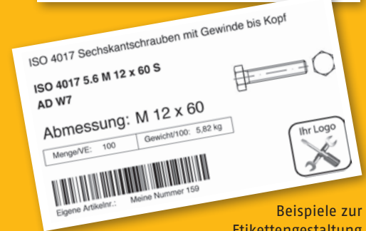
Beispiele zur Etikettengestaltung